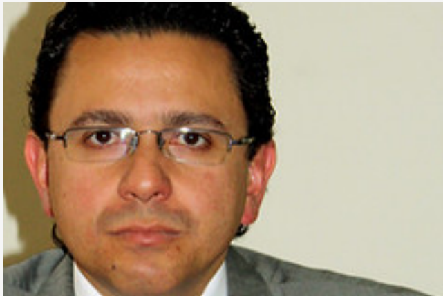
Viceministro de Justicia, Miguel Ceballos

En conversación con La Silla Vacía, el viceministro Ceballos expresó que efectivamente es socio de Datexco, pero que después de consultar con los abogados del Ministerio, decidió renunciar a su cargo dentro de la empresa.