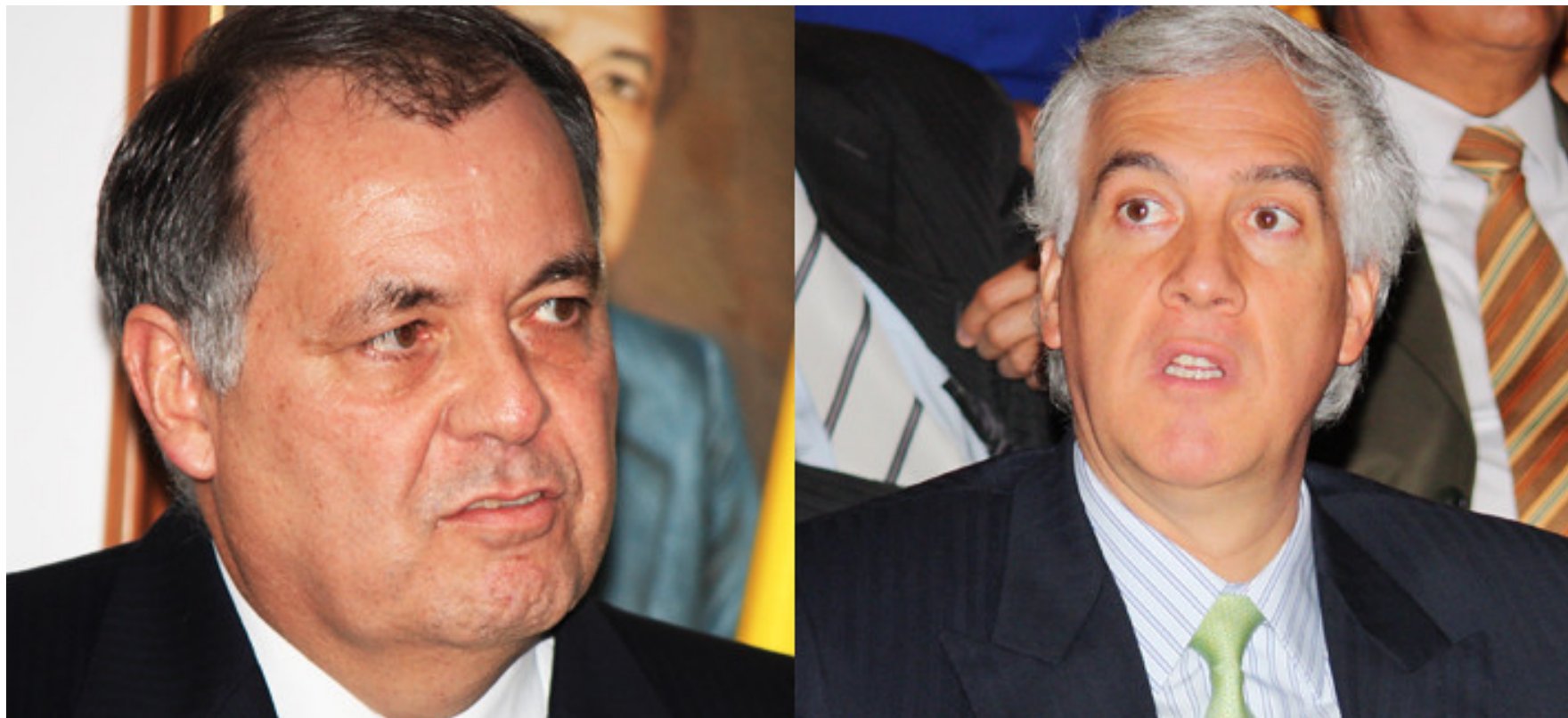
El Procurador Alejandro Ordóñez suspendió provisionalmente al Alcalde de Bogotá Samuel Moreno por tres meses.